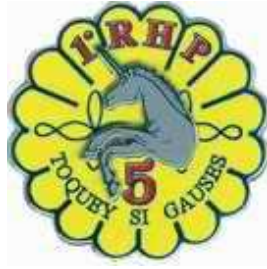
5 ème escadron