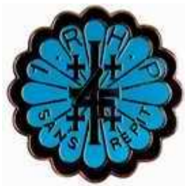
4 ème escadron