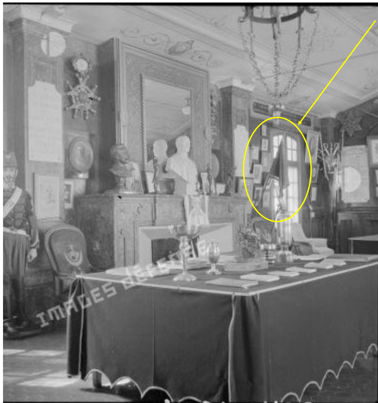
Étendard du 1 er régiment des Lanceros de Zaccateras