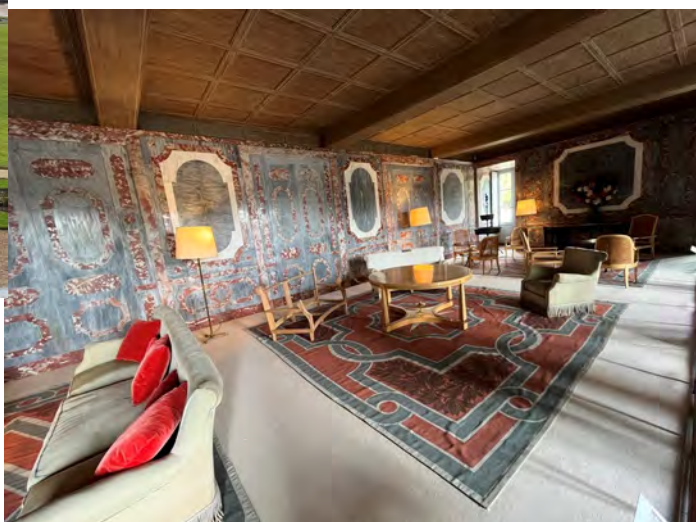
Au château de Rambouillet