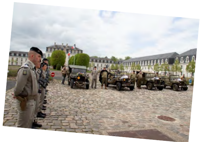
Piquet d'honneur du 501 e RCC—Jeeps et reconstitueurs de l'Univem de Satory

Discours du commissaire général TRÉMENBERT