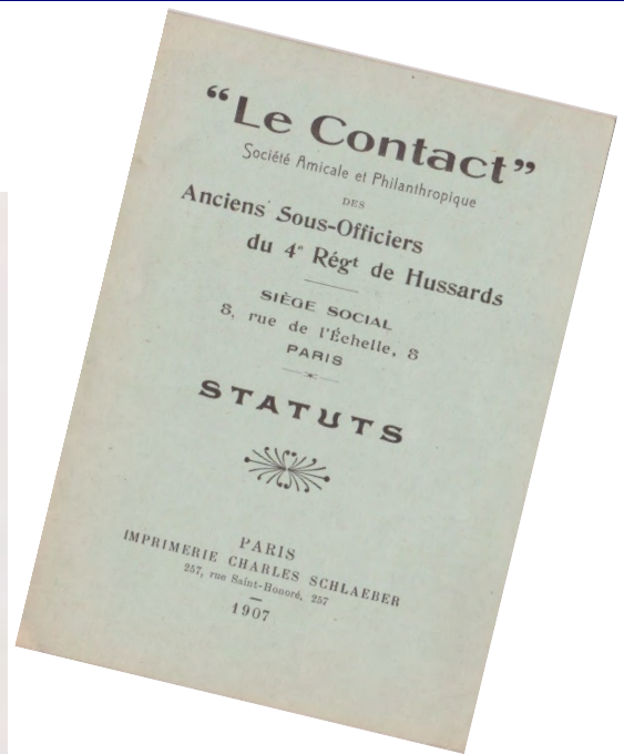
La 1ère amicale des sous-officiers créée en 1907