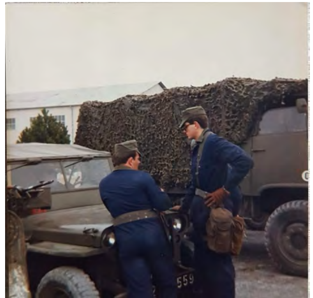
Ci-dessous, 3 photos transmises par Éric RUDAND, appelé au 4ème hussards à Laon EN 1983